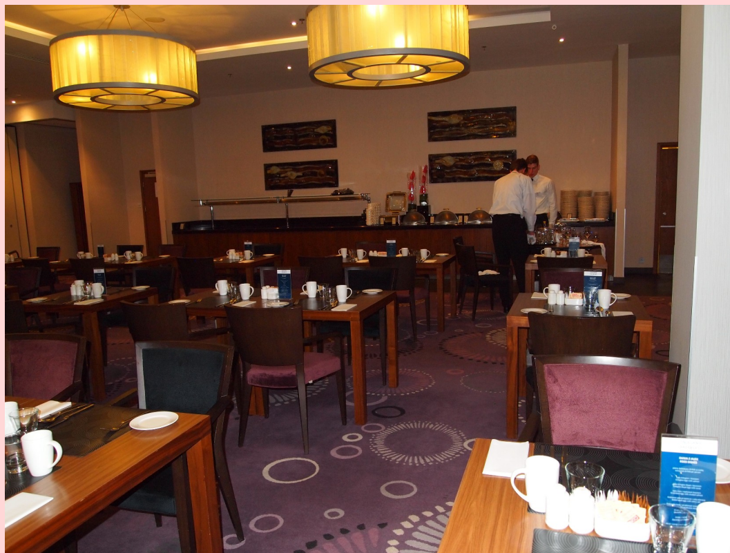
HOTELOWA RESTAURACJA - HOTEL RESTAURANT