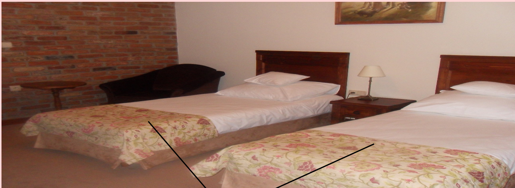
TWIN BEDS - DWA, POJEDYNCZE ŁOŻKA